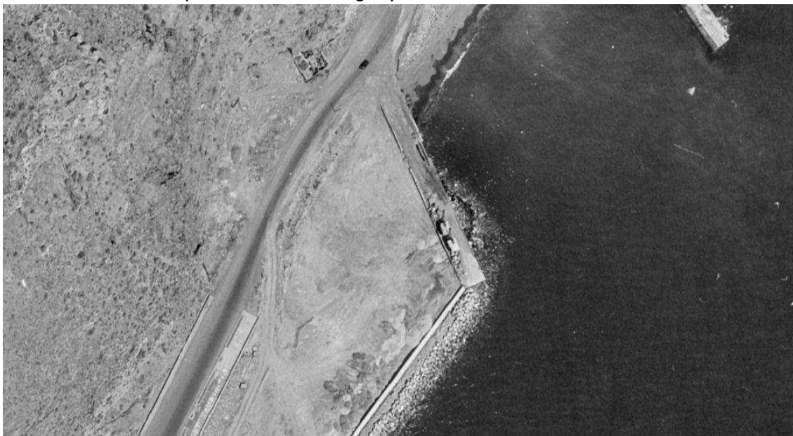
Vuelo año 1966.

En 1965 la Avenida Anaga se estrechaba a la llegada a Valleseco, existía un espigón (muelle alemán) que partía de la costa en dirección Sur-Sureste. Un año después, tomando como referencia el muelle alemán se ganó al mar un terreno paralelo a la costa, de tal forma que la avenida Anaga quedaba más retirada de la línea costera.