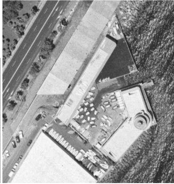
Vuelos años 1991 (izquierda) y 1998 (derecha)

En 1998 se construye una plataforma paralela a la Avenida Anaga a su misma cota. La vía interior del muelle, se dejó de intersectar con la avenida a la altura de Valleseco y pasó a ser una vía con desarrollo en semitúnel.